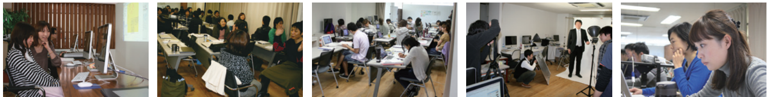
公共職業訓練では、次の3つの指導を総合的に行い、求職者の就職を支援します。①教科指導(職業に必要な専門的な知識・技術の習得)②生活指導(職業人に相応しい生活態度の涵養)③職業指導(就職・キャリア形成に係る助言)